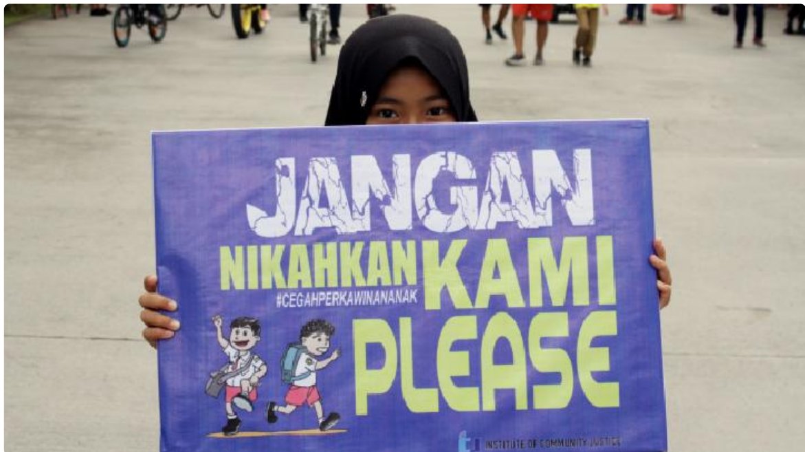
Ilustrasi aksi anti perkawinan anak.

Arri menekankan bahwa perkawinan anak dapat mengakibatkan berbagai macam dampak negatif pada anak perempuan. Misalnya saja dari segi biologis. Ketika perempuan menikah di usia anak, ia akan mendapatkan risiko komplikasi pada kehamilan. Komplikasi ini dapat hadir dalam bentuk persalinan macet hingga konsekuensi kesehatan pada bayi. Sementara itu, aspek psikologis dari anak perempuan ini akan banyak terganggu.